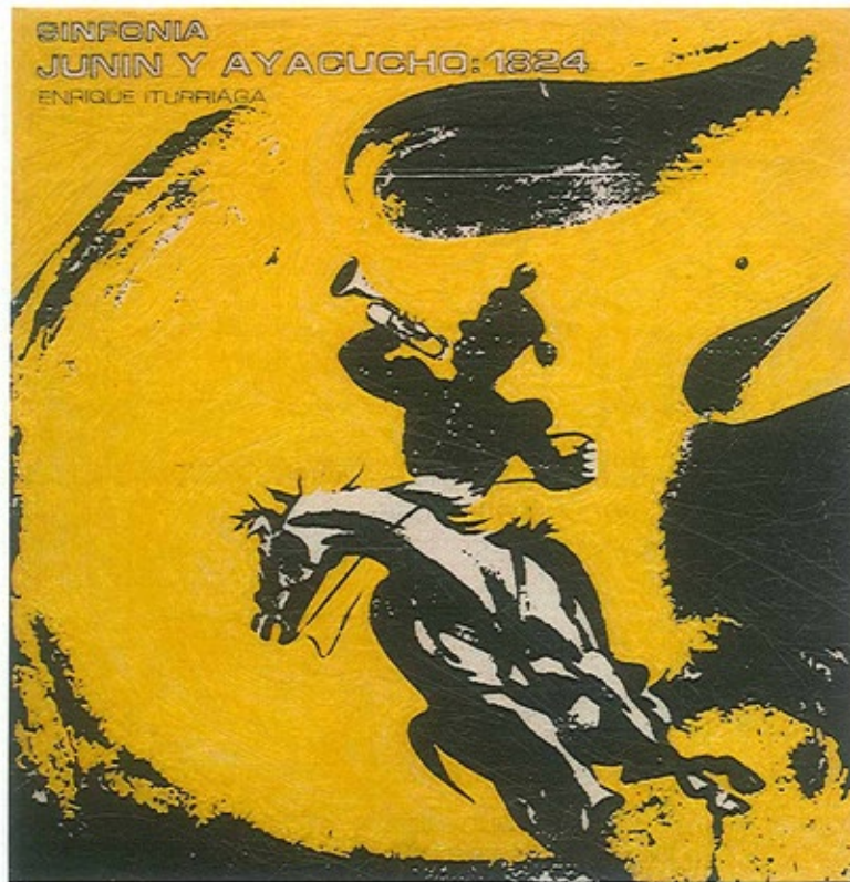
Cuadros de la serie "Toques militares". Medidas: 31,3 x 31,3 cm.